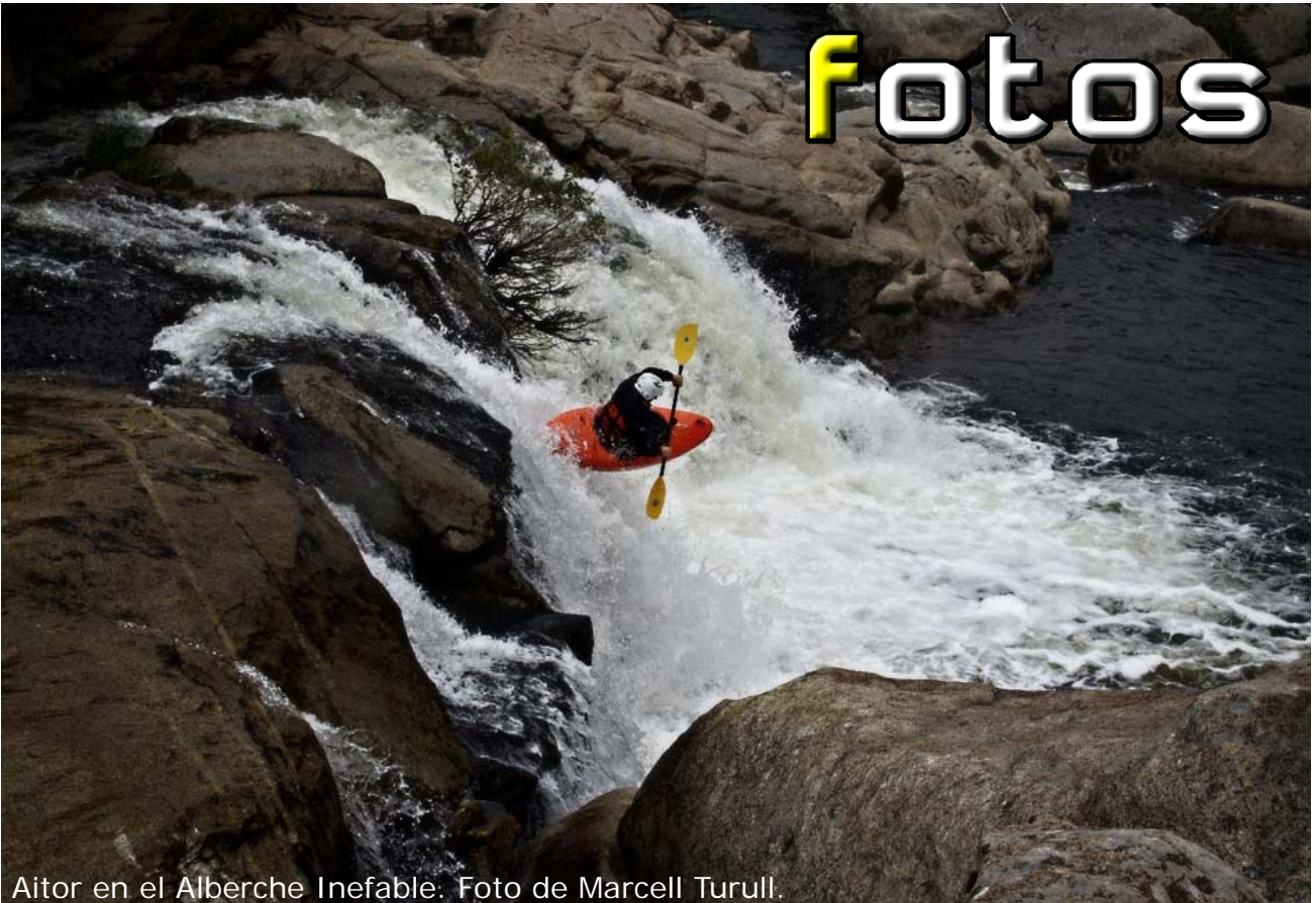
Aitor en el Alberche Inefable.