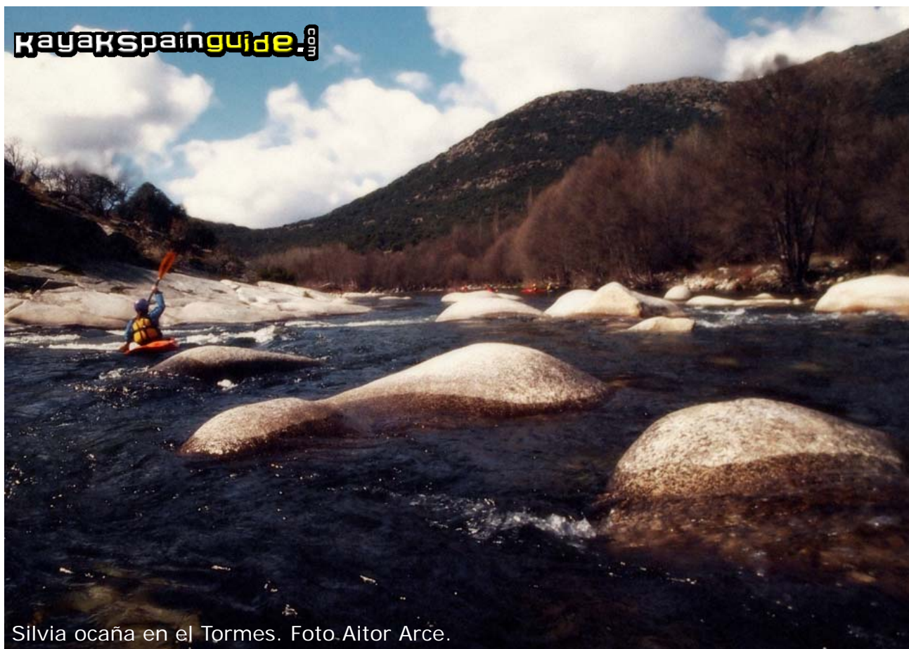
Silvia ocaña en el Tormes.