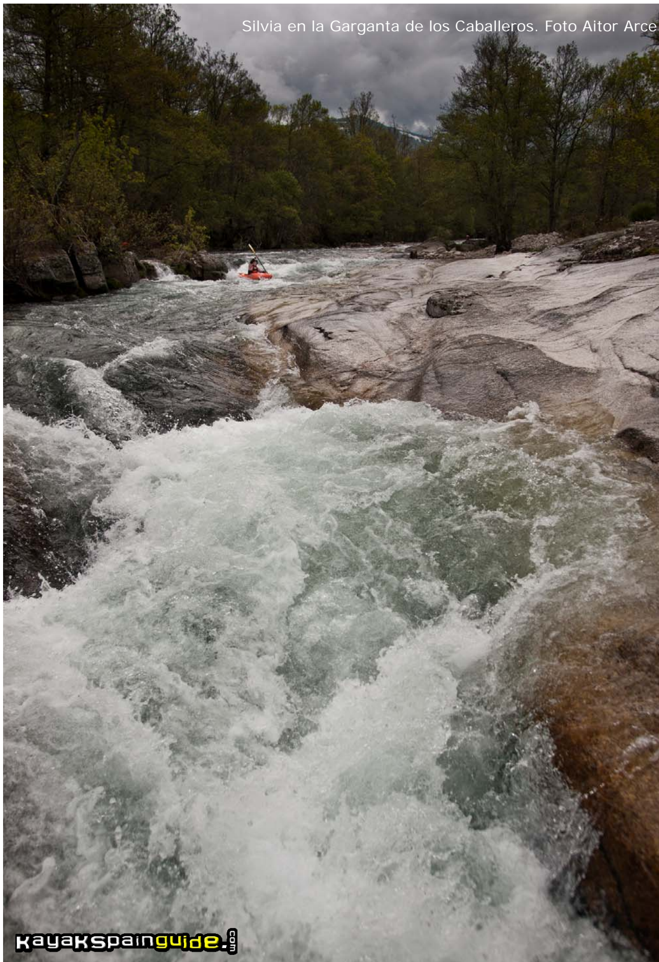
Silvia en la Garganta de los Caballeros.