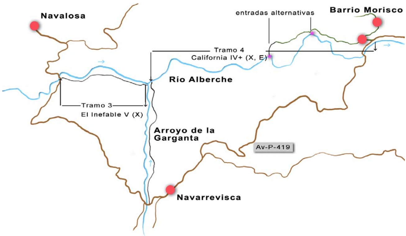
Croquis de los tramos del Alto Alberche.

Los siguientes vienen a ser más suaves y accesibles. Hemos de advertir que el Alberche es un río capaz de variaciones de caudal muy bruscas y acusadas. Hemos sido testigos de cómo aumentaba su caudal en más de 100 metros cúbicos por segundo en menos de dos horas. Por este motivo siempre debemos conocer la previsión meteorológica, sobre todo si queremos remar los tramos altos, su rango de caudal para la navegación es estrecho y además hay secciones encañonadas en las que salir es difícil. Sin embargo en los tramos inferiores un aumento del caudal considerable es fácilmente remediable ya que el valle aquí es muy abierto y la carretera no anda lejos.