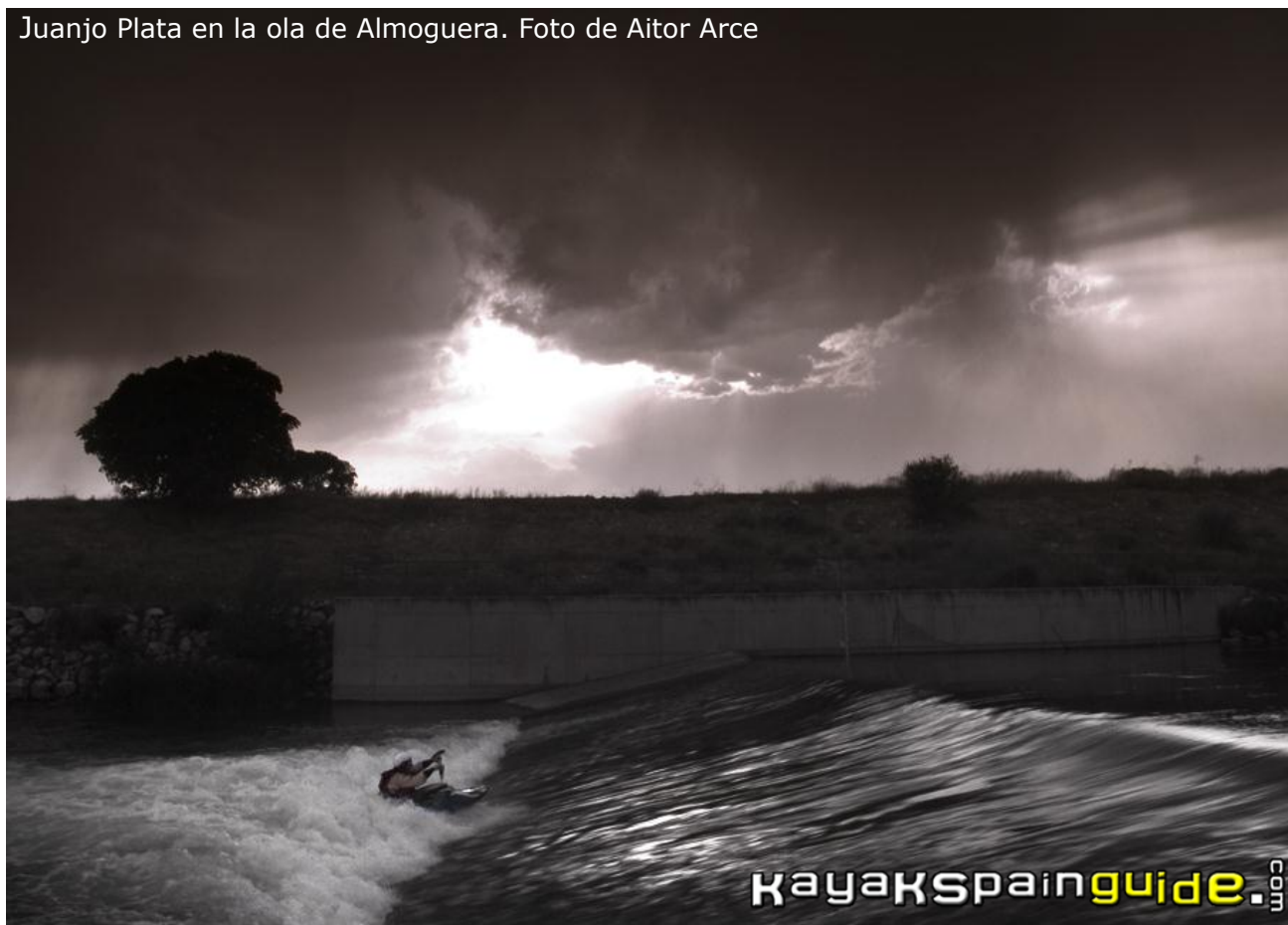
Juanjo Plata en la ola de Almoguera.