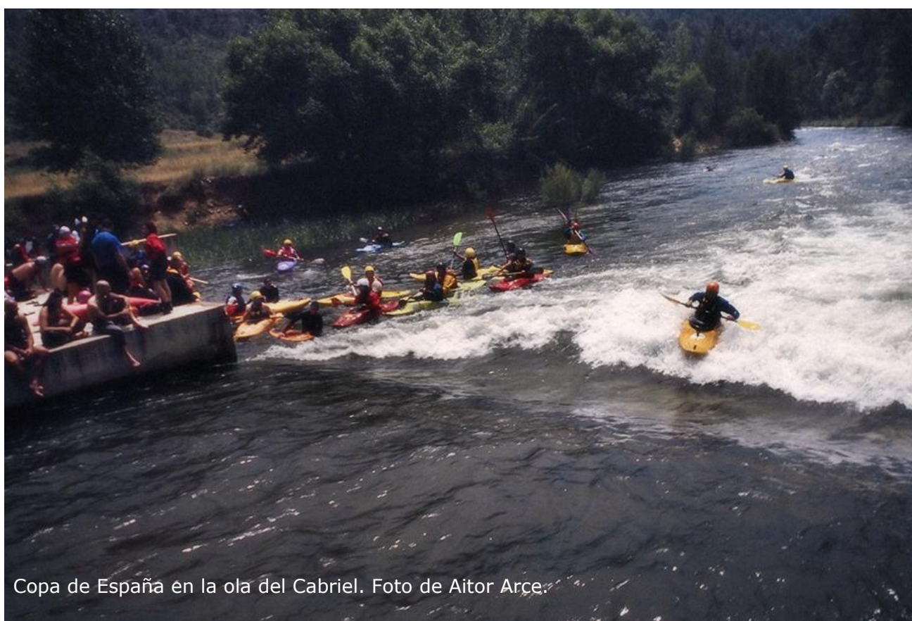
Copa de España en la ola del Cabriel.