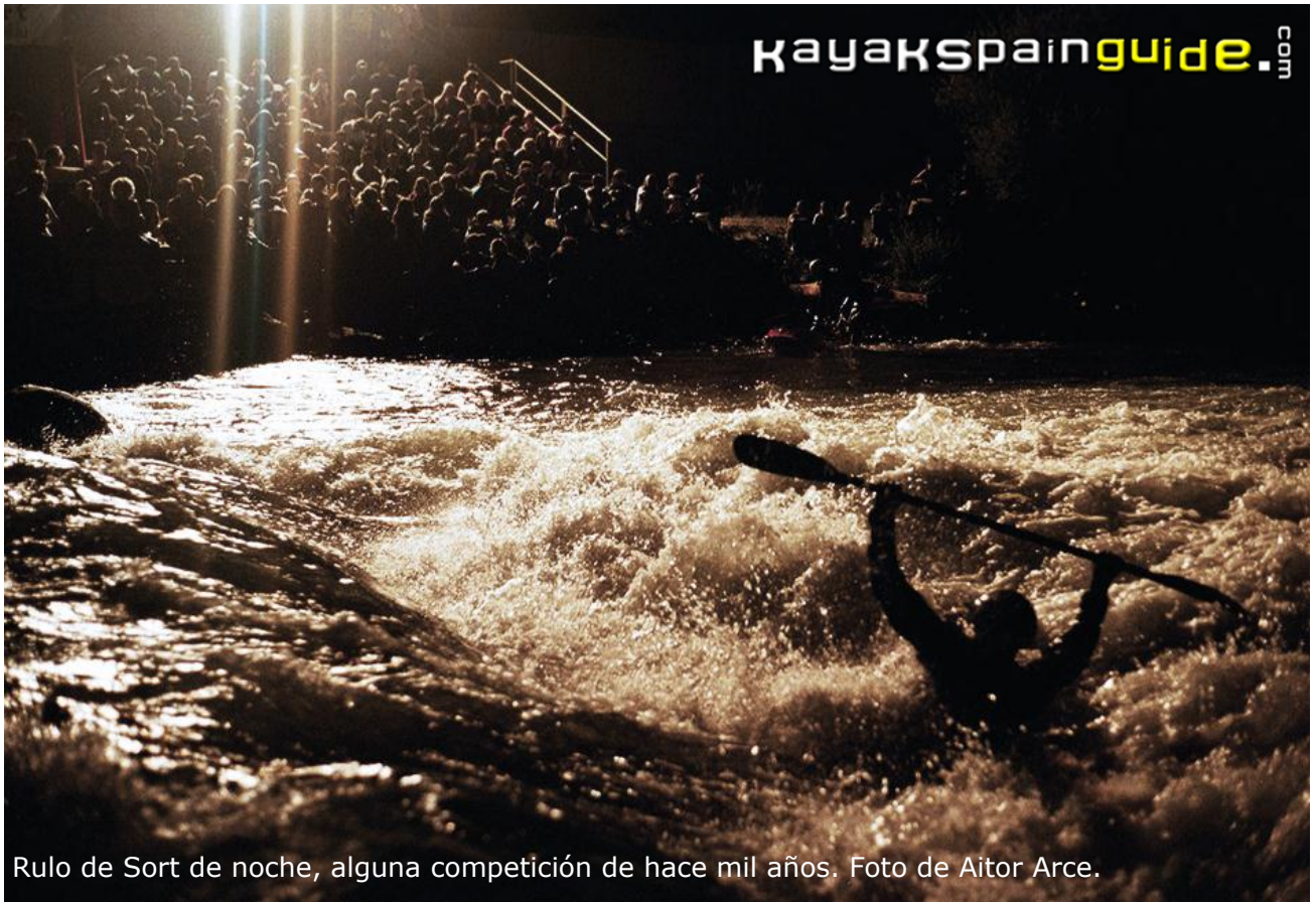
Rulo de Sort de noche, alguna competición de hace mil años.