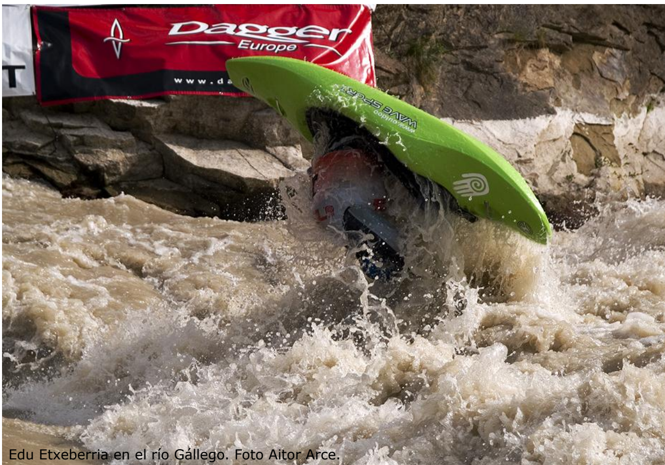
Edu Etxeberria en el río Gállego. Foto Aitor Arce.