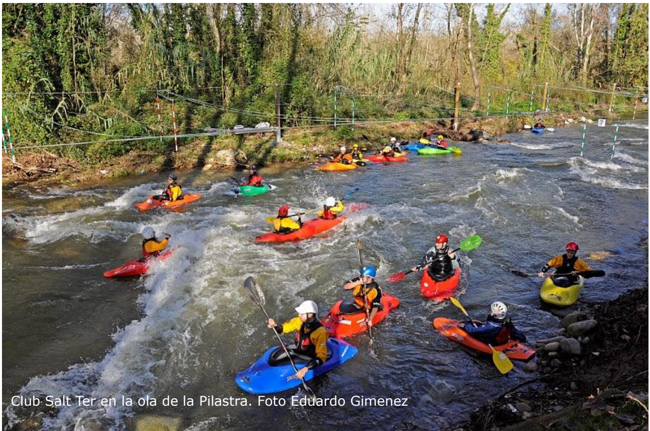
Club Salt Ter en la ola de la Pilastra.