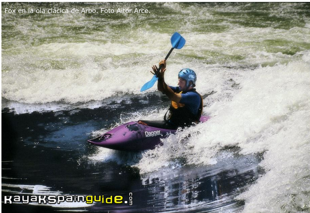
Fox en la ola clásica de Arbo.