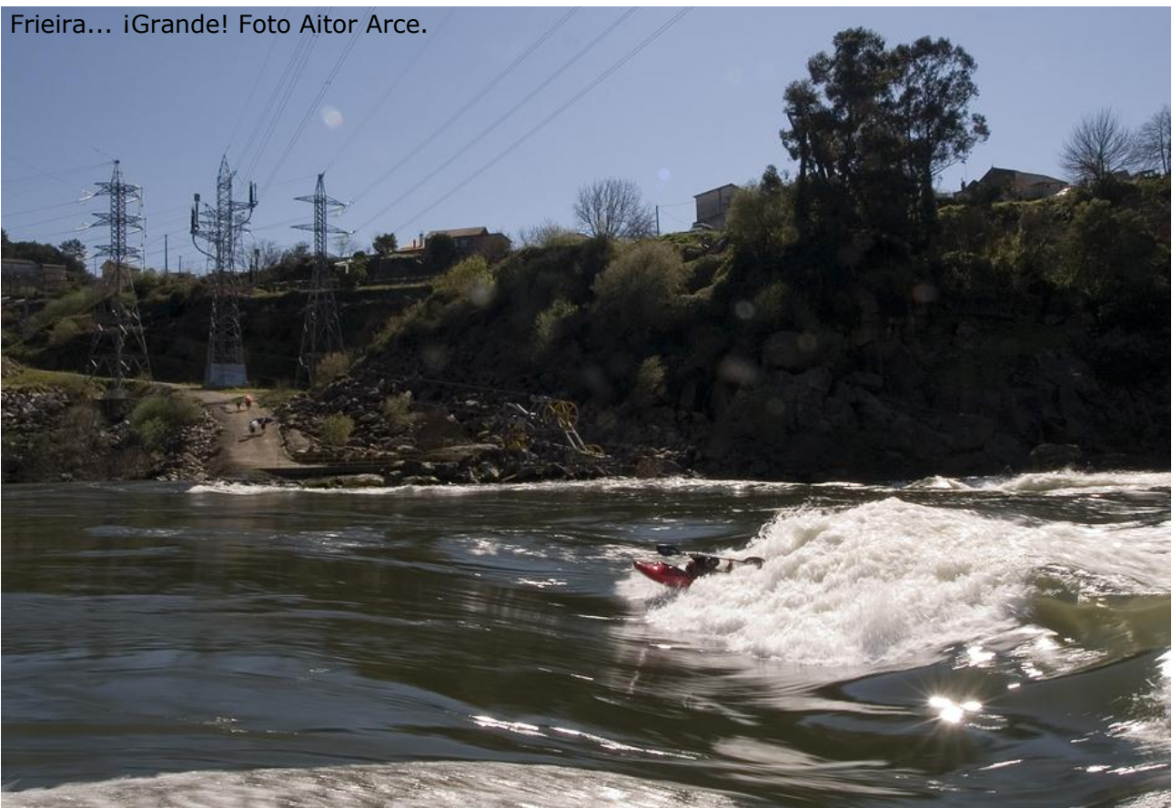
Frieira... ¡Grande!