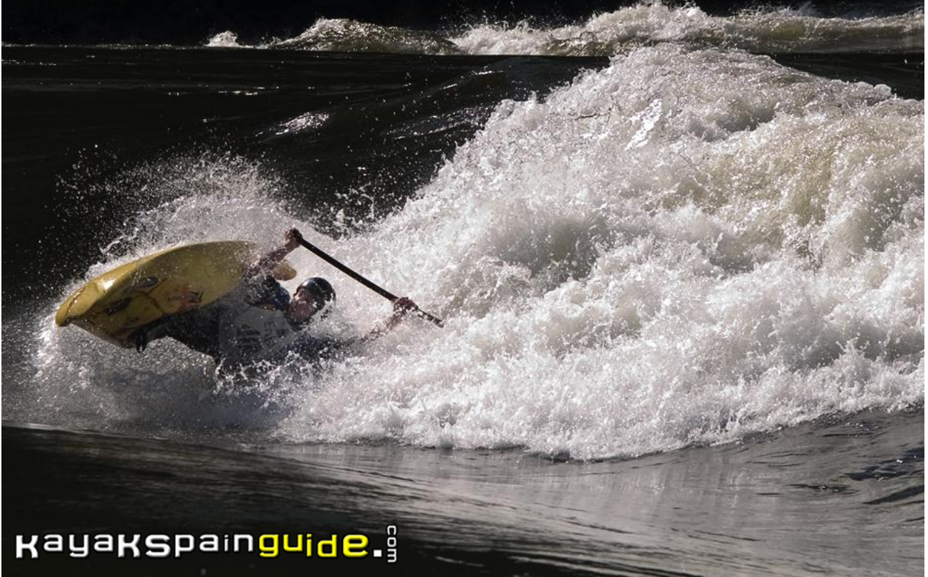
Domenjo compitiendo en la ola de Frieira.